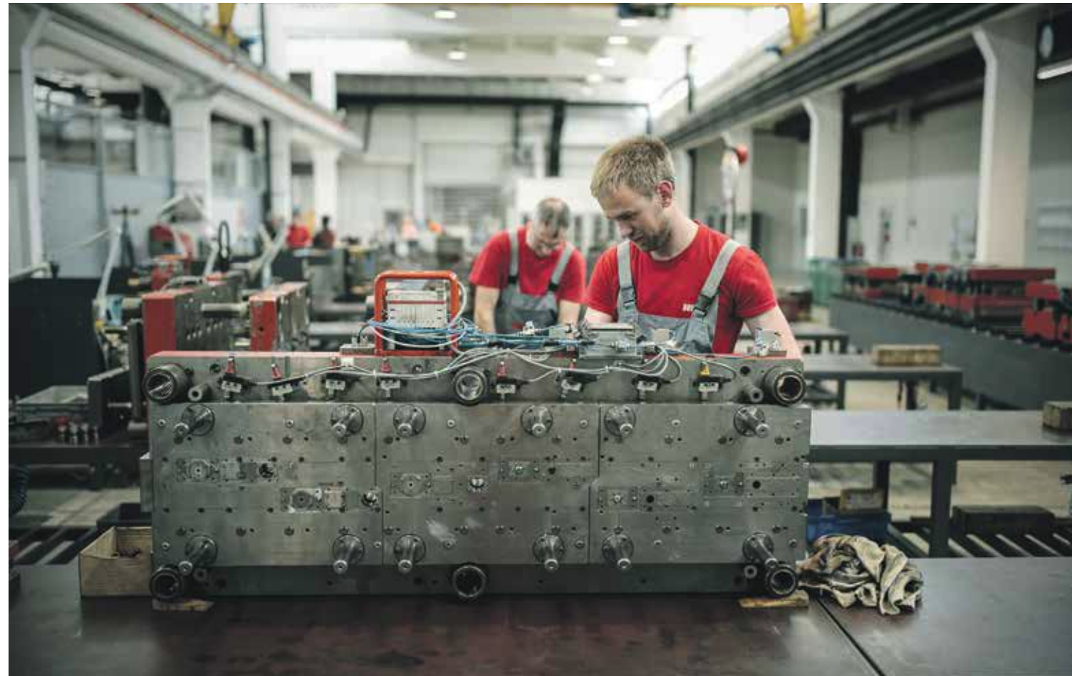
Slovenske gospodarske družbe so lani ustvarile 44.415 evrov neto dodane vrednosti na zaposlenega, leta 2008 pa približno 35.000 evrov.

Nekateri ukrepi so bili v Sloveniji po njegovih besedah uspešno izvedeni, predvsem na področju izobrazbe visoko usposobljenega inženirskega kadra, gradnje cestne