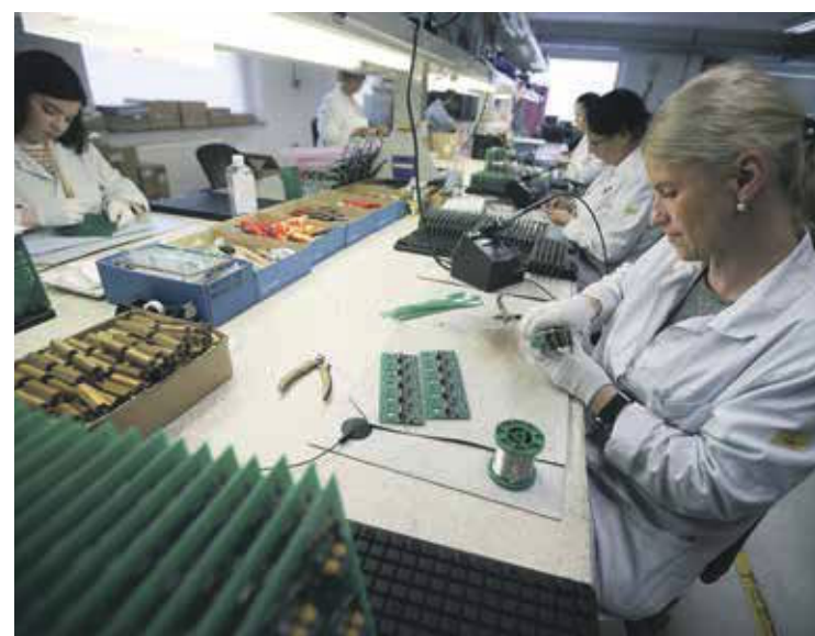
MI elektronika je med največjimi ponudniki storitev elektronske proizvodnje v Sloveniji, po zahtevnosti pa med vodilnimi.

Obenem so povečali tudi število zaposlenih z lanskih 40 na letošnjih 46, še leta 2014 pa je bilo le 27 zaposlenih. Kot poudarja Mertik, na prakso redno jemljejo tudi študente, ki prihajajo k njim